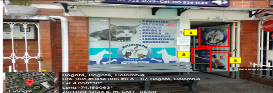
Fotografía No. 4

En la cual se evidencian tres (3) elementos de PEV identificados con los números 1,2, y 3, los cuales se encuentran ubicados en la puerta de ingreso al establecimiento comercial.